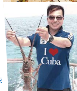
世界十大名灘：巴拉德羅