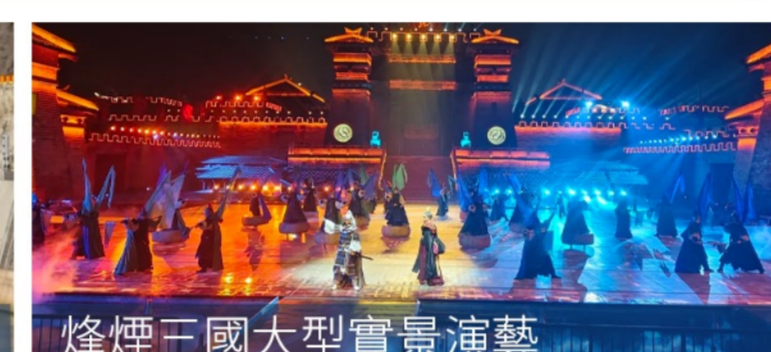
烽煙三國大型實景演藝