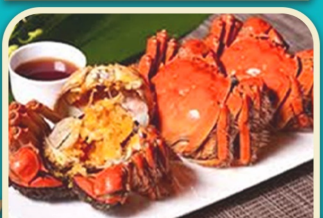
贈送 陽澄湖大閘蟹每人2隻