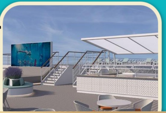
★長江行極光號·甲板